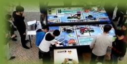
Oficina de Programação e Robótica da ESAS Lúcio Botelho